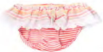
PANTY RIGHE CON BALZA MULTICOLOR E SANGALLO MOD 100 - 103 Col. Righe multicolor Tg. 2-6A