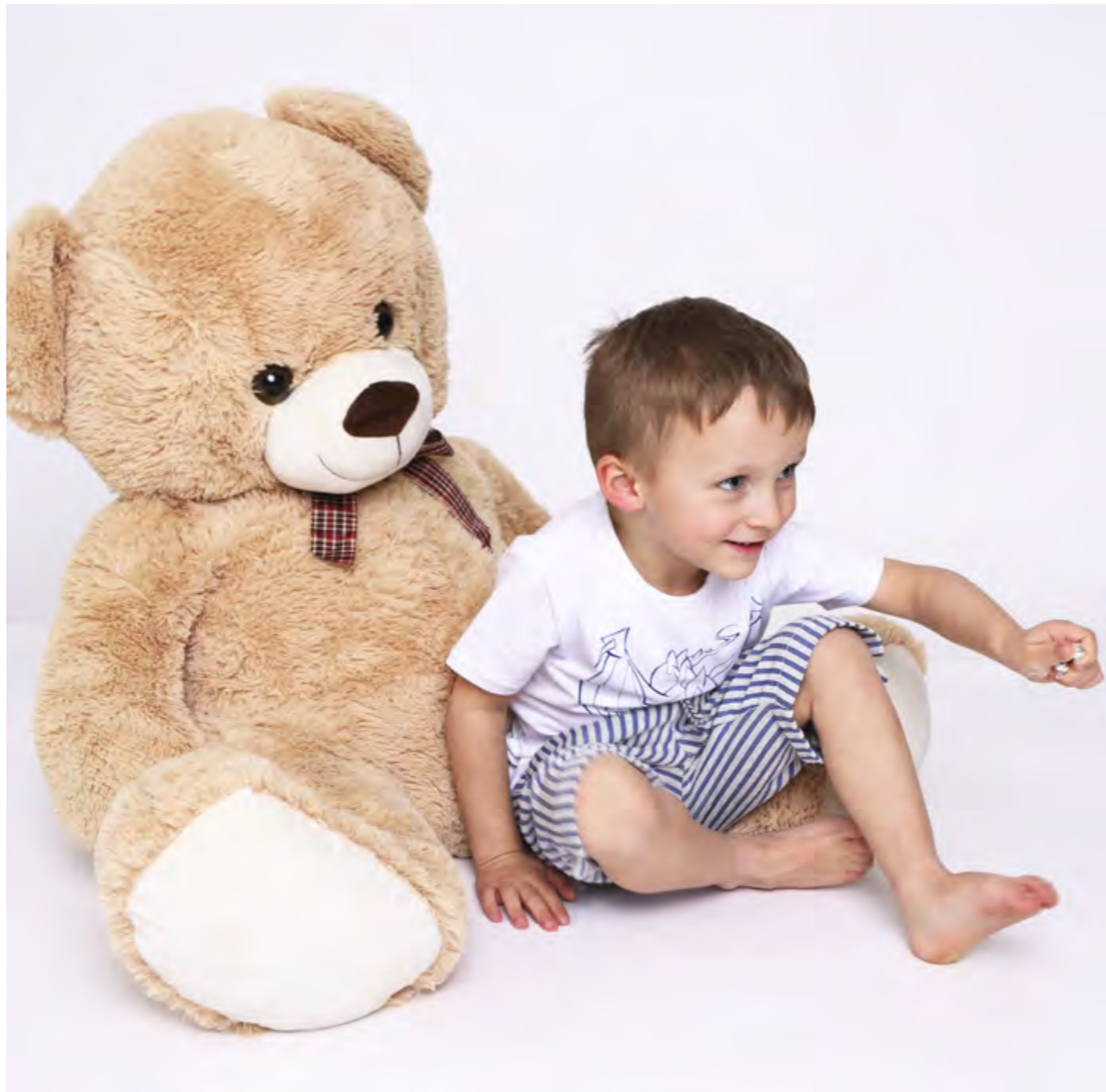
BERMUDA A COSTE BLU COULISSE MOD 943 - 946 Col. Rigato blu Tg. 2-6A