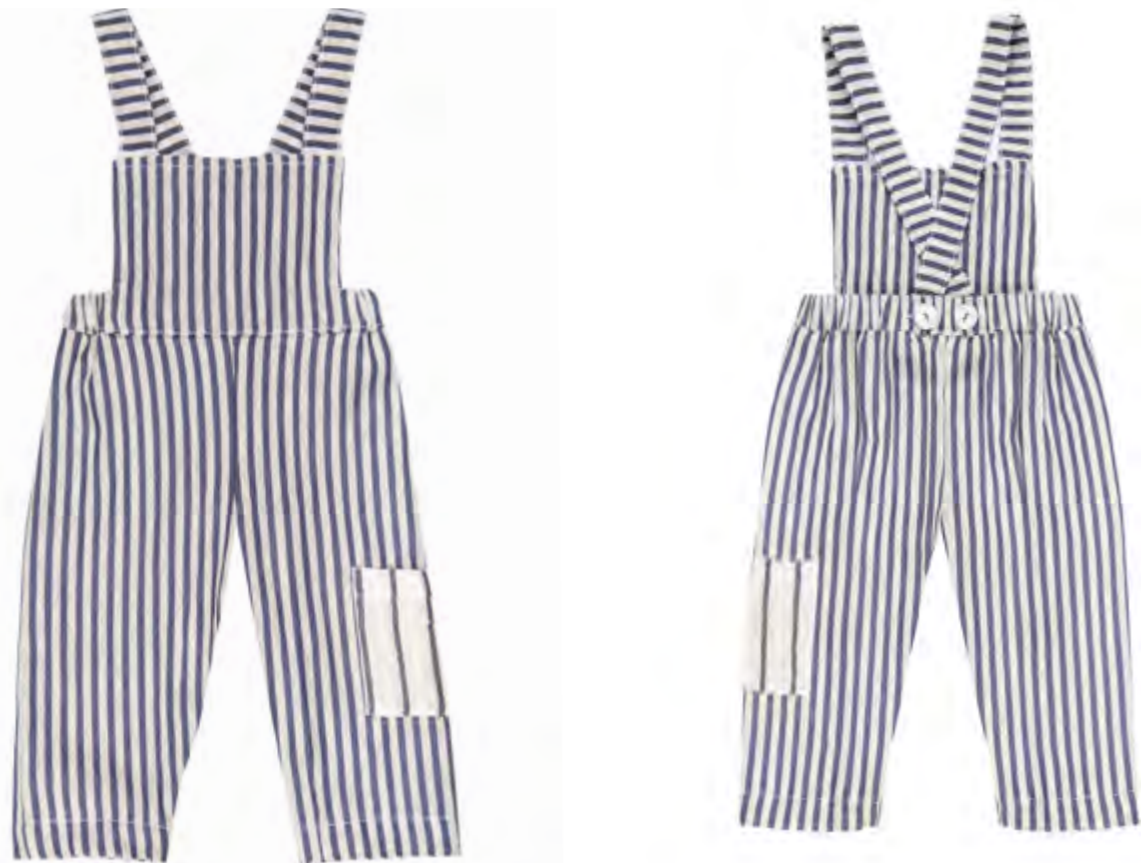
SALOPETTE LUNGA - 1 TASCA -. BRETELLE IN RIGATO REGOLABILI RETRO MOD 861-865 Col. Rigato blu Tg. 3-18M