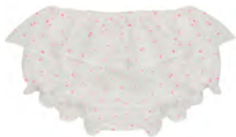
SWIM BLOOMER CUORI CON BALZA MOD 047 - 051 Col. Bianco e rosa Tg. 3-18M