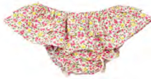
SWIM BLOOMER FIORI ROSA E ORO CON DOPPIA BALZA MOD 310 - 314 Col. Fiori rosa e oro Tg. 3-18M