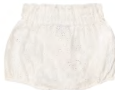
BLOOMER IN PIZZO SANGALLO A VITA ALTA MOD 017 - 021 Col. Panna Tg. 3-18M