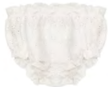
SWIM BLOOMER PIZZO SANGALLO MOD 006 - 010 Col. Panna Tg. 3-18M