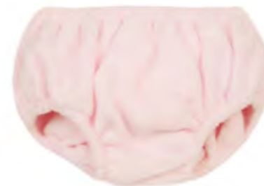
BLOOMER IN PIZZO SANGALLO A VITA ALTA MOD 297 - 301 Col. Rosa chiaro Tg. 3-18M