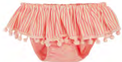
PANTY POIS CON BALZA RIGHE E POMPON GRANDE MOD 060 - 063 Col. Pois rosa e righe