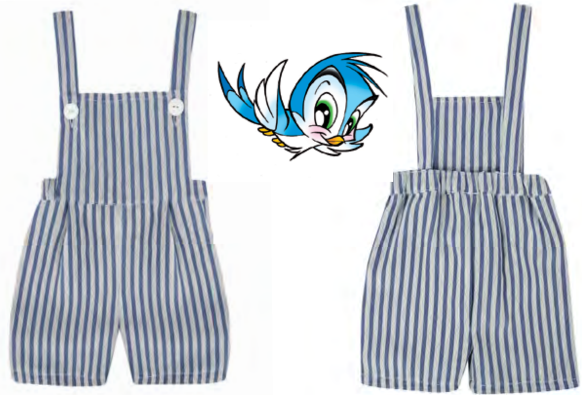
SALOPETTE CORTA CON BRETELLE REGOLABILI RIGHE BLU MOD 856-860 Col. Rigato blu Tg. 3-18M