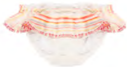
PANTY PIZZO BALZA RIGHE E FRANGIA MOD 302 - 305 Col. Panna e righe Tg. 2-6A