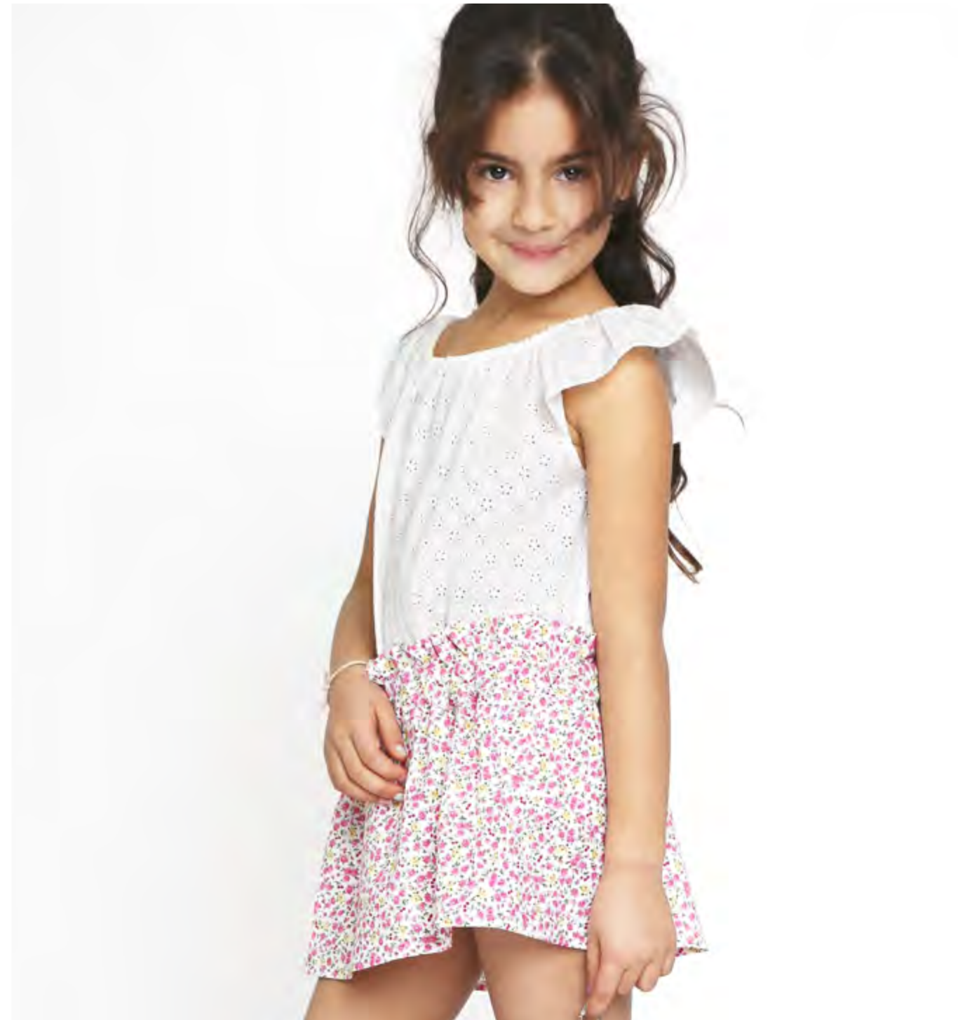
GONNA CORTA A FIORI MOD 741 - 744 Col. Fiori oro Tg. 2-6A