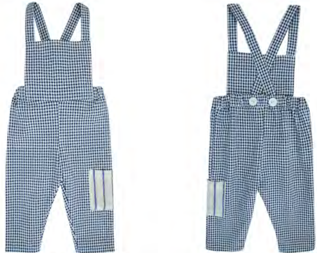
SALOPETTE LUNGA - 1 TASCA -. BRETELLE VICHY REGOLABILI RETRO MOD 881-885 Col. Vichy bco/blu Tg. 3-18M