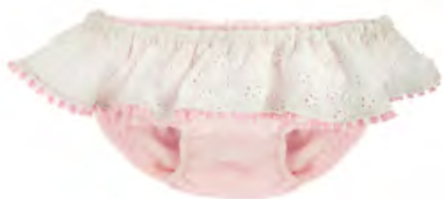
PANTY SPUGNA BALZA PIZZO E FRANGIA MOD 327 - 33 Col. Rosa e panna Tg. 2-6A