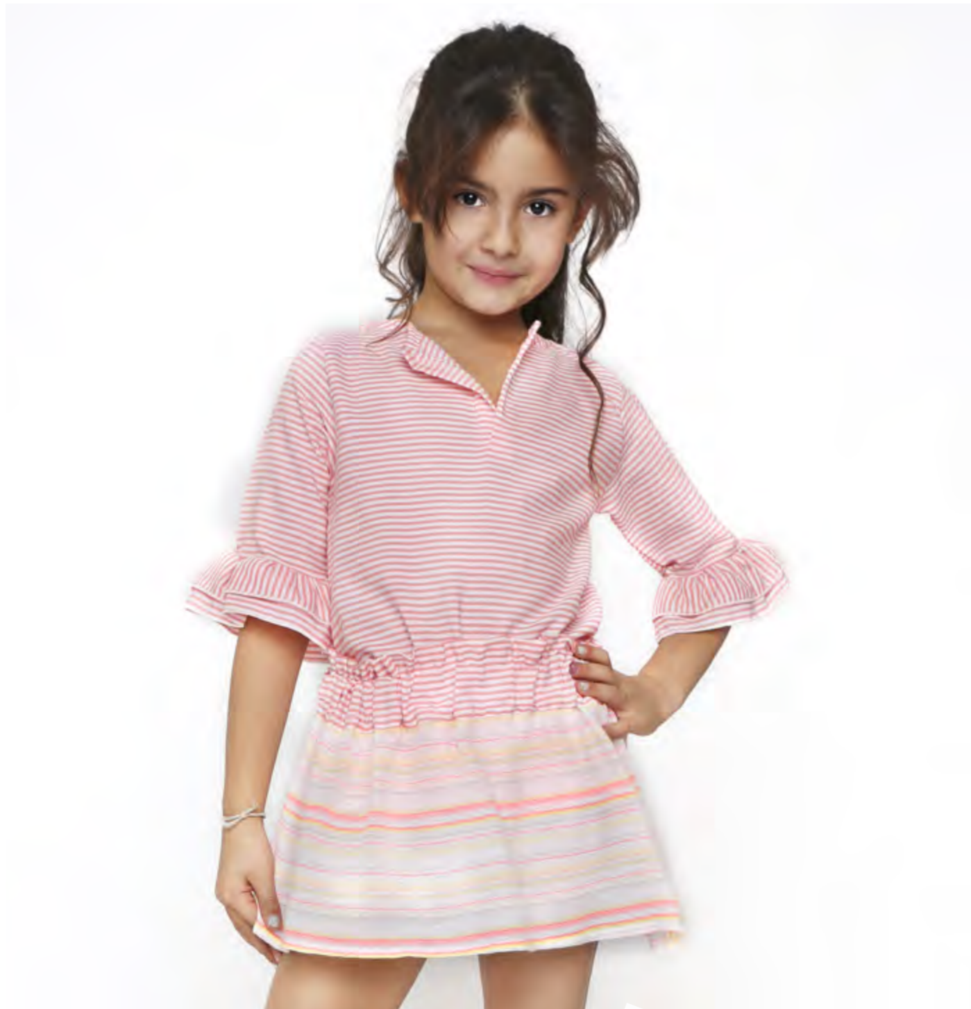
GONNA CORTA A RIGHE MOD 745 - 748 Col. Righe multicolor Tg. 2-6A