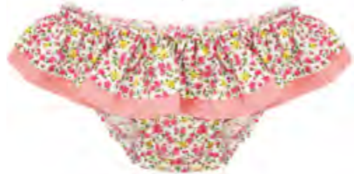
SWIM PANTY FIORE ORO DOPPIA BALZA MOD 052 - 055 Col. Fiori oro e pois Tg. 2-6A